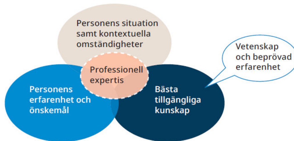
Figur 1. Modellen för evidensbaserad praktik