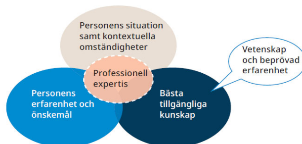
Figur 1. Modellen för evidensbaserad praktik

Avslutningsvis kan vi förtydliga att all viktig kunskap inte ryms inom vetenskap och beprövad erfarenhet.